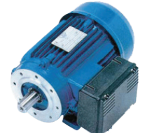
B14 - Montado en cara con orificios roscados (Cara C / brida FC)