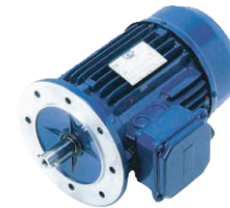
B5 - Montado en brida (IEC = brida FF / Nema = "Brida D")