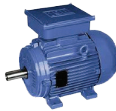
B3 - Montado en patas

En general, los cabezales de mando de PCP tienen una placa base del motor para motor montado sobre patas, pero podría proponerse una opción alternativa.